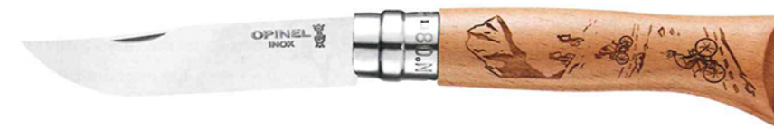
Geschenk für alle Bike-Fans: das Taschenmesser „Gravure Sport“ von Opinel.

Die Snacks werden in der Lunchbag von Lékúé verstaut.